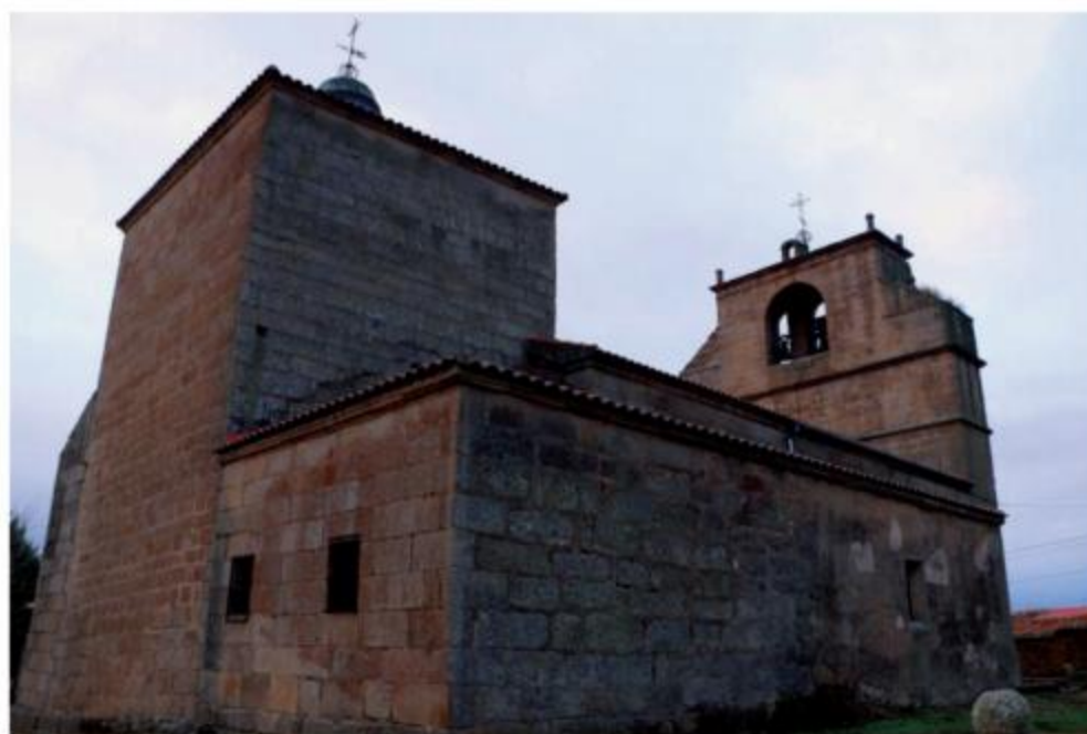
Fachada este, ábside, y fachada norte, evangelio.